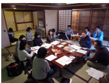
第 5 回ワークショップ

※「奉仕」での植栽と落ち葉掻きについては、「緑地管理のワークショップ」でその活動内容について話し合い、調整